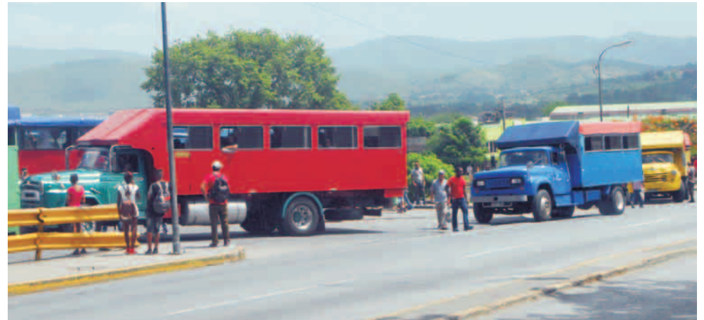
Exteriores en la terminal intermunicipal el jueves pasado

"Nosotros pactamos como Gobierno provincial precios máximos, aunque cada municipio puede bajar los precios previa evaluación y aprobación por los Consejos de Administración Municipales, para sus diferentes rutas".