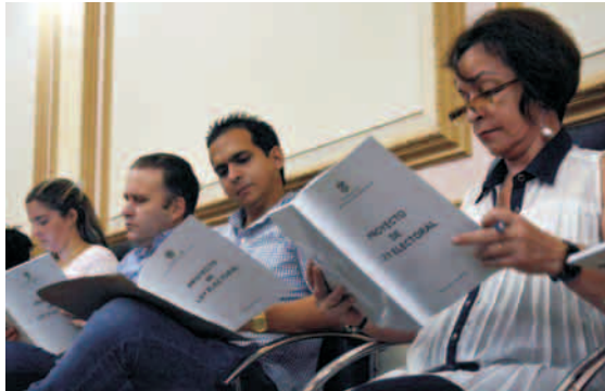
cada 30 000 habitantes de un municipio o fracción mayor de 15 000, y en el caso de que el número de habitantes de un municipio sea de 45 000 o inferior a esta cifra, se eligen siempre dos (2) diputados; manteniendo el principio de que hasta un 50% de estos son seleccionados de entre los delegados de las asambleas municipales del Poder Popular.

También se prevé la modificación de la proporción establecida actualmente para la elección de los diputados al parlamento cubano, "en razón de que se elija un (1) diputado por