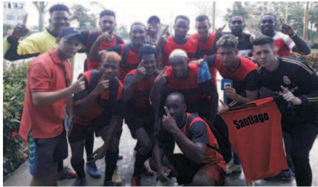
Los indómitos están decididos a mejorar sus actuaciones de los últimos años

Pase lo que pase, mis respetos para estos guerreros del fútbol en la llamada "tierra caliente", que desde su arribo a la capital vultabajera -el pasado viernes- han tenido que soportar un sinnúmero de problemas con el hospedaje, lo cual les ha