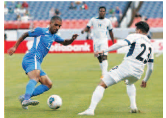
Los cubanos no han podido frenar a ninguno de sus rivales en la Copa Oro 2019